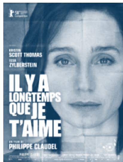
↑ En 2008, Philippe Claudel réalisa le film Il y a longtemps que je t'aime , avec Kristin Scott Thomas. Le film explore à son tour les questions du Mal et de la culpabilité.

En outre, Brodeck a du mal à faire le tri entre la réalité et ses cauchemars, qui semblent à leur tour « tellement vrais ». La critique du vieux maître Limmat concernant la première version du « rapport » porte précisément sur ce mélange entre songe et réel qu'opère Brodeck. Le protagoniste sait d'ailleurs qu'il ne détient aucune preuve de ce qui s'est passé au village et Diodème va jusqu'à contester que l' Anderer ait vraiment existé. Au dire de Brodeck, la