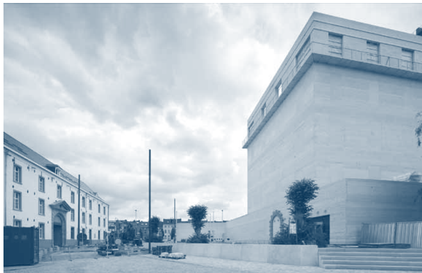
↑ Le nouveau musée et l'ancienne caserne.

L'éducation à l'Holocauste doit fusionner avec l'éducation aux droits de