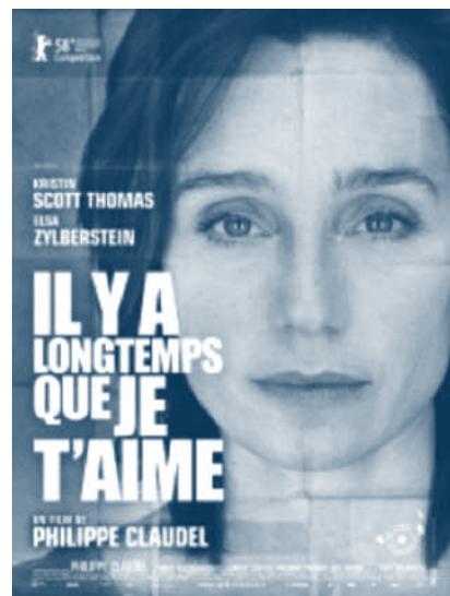
↑ En 2008, Philippe Claudel réalisa le film Il y a longtemps que je t'aime , avec Kristin Scott Thomas. Le film explore à son tour les questions du Mal et de la culpabilité.

En outre, Brodeck a du mal à faire le tri entre la réalité et ses cauchemars, qui semblent à leur tour « tellement vrais ». La critique du vieux maître Limmat concernant la première version du « rapport » porte précisément sur ce mélange entre songe et réel qu'opère Brodeck. Le protagoniste sait d'ailleurs qu'il ne détient aucune preuve de ce qui s'est passé au village et Diodème va jusqu'à contester que l' Anderer ait vraiment existé. Au dire de Brodeck, la