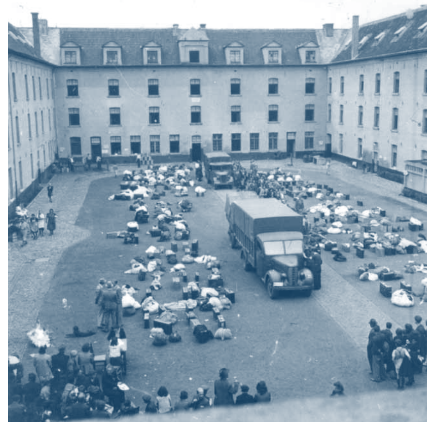
↑ Arrivée de prisonniers dans la cour intérieure de la caserne Dossin, 1942.

En troisième lieu, nous nous proposons consciemment d'offrir dans notre matériel tant la perspective des « victimes » que celle des « bourreaux » et celle des « témoins ». Cette combinaison n'implique nullement que l'histoire des victimes passe au second plan. Mais il va de soi que l'étude du point de vue des bourreaux et des témoins permet d'approfondir notre compréhension des dynamiques psychosociales incitant des groupes à la violence