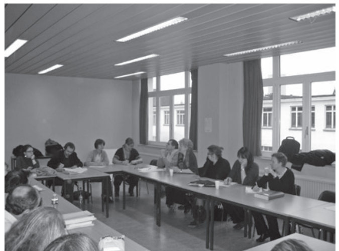
Groupe de travail