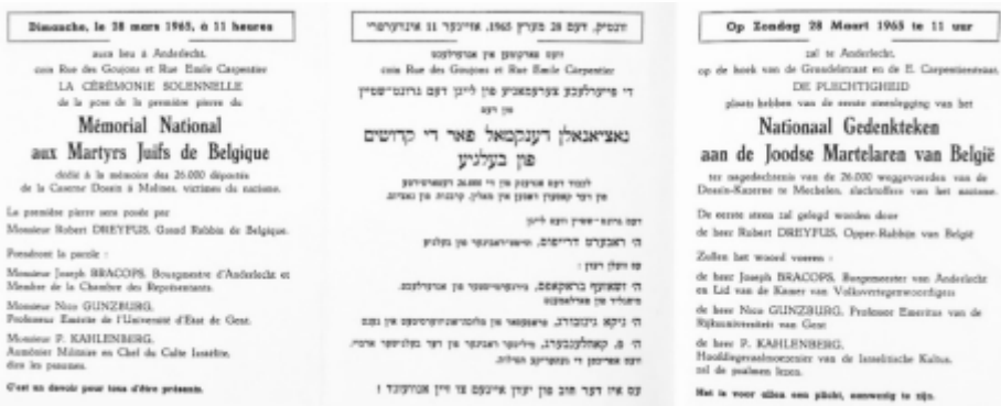
Foto 1: Uitnodigingskaart voor de plechtige ceremonie bij de eerste steenlegging van het Gedenkteken