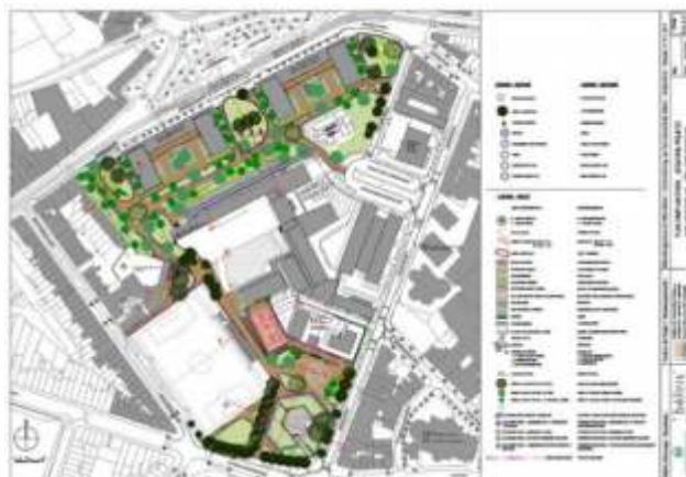
Foto 6: Ontwerp van wijkcontract voor het huizenblok Albert, onder leiding van de Koninklijke Commissie voor Monumenten en Landschappen en Beliris