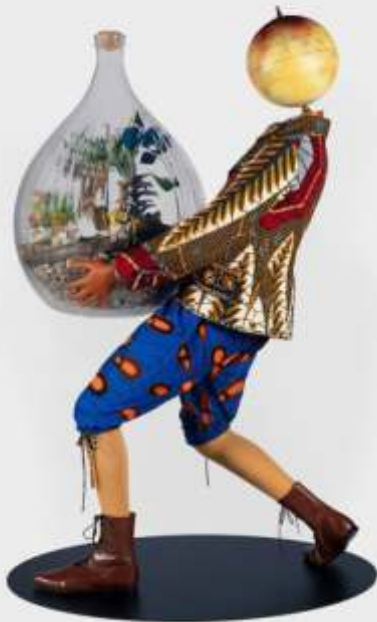
Botanist Kid (Boy) ou Enfant au globe postcolonial, 2024, CBE RA Yinka Shonibare (né en 1962) © Yinka Shonibare CBE RA

Ils nous invitent à repenser la notion d'identité européenne, à considérer honnêtement la place de l'Europe dans le monde et à imaginer de nouvelles façons d'être et de vivre ensemble.