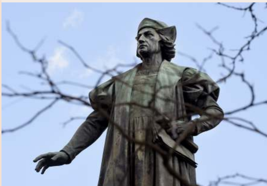
Columbus Circle, Syracuse, VS

Part du principe que cette mention doit s'adresser à un large public.