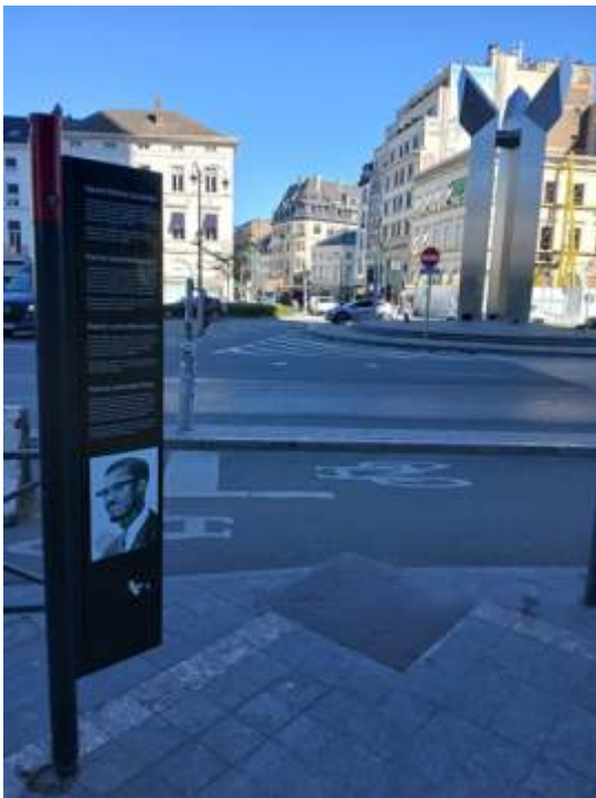
▲ Le square Patrice Lumumba inauguré en juin 2018 est un hommage de la Région de Bruxelles-Capitale au Premier ministre congolais assassiné en 1961

En 1932, la Société coloniale de Brême inaugure le Kolonialelefant , un éléphant en pierre de près de dix mètres de haut, en mémoire des soldats allemands morts dans les colonies pendant la Première Guerre mondiale. Aujourd'hui, rebaptisé Anti-Kolonial-Denk-Mal , ce monument se veut à vocation anticoloniale en tant que Gegendenkmal