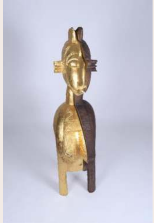
Baga Nimba (Or), 2019, Niyi Olagunju (né en 1981) © Niyi Olagunju