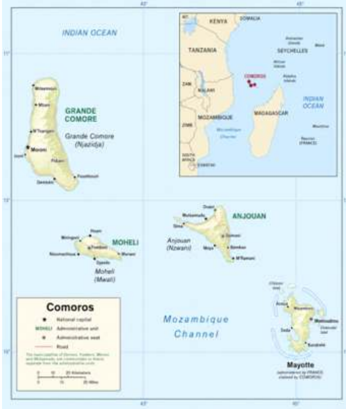
Les Comores avec Mayotte, qui resta dans le giron français

mogène fabrique ainsi des « situations irrégulières » et des drames humains à répétition.