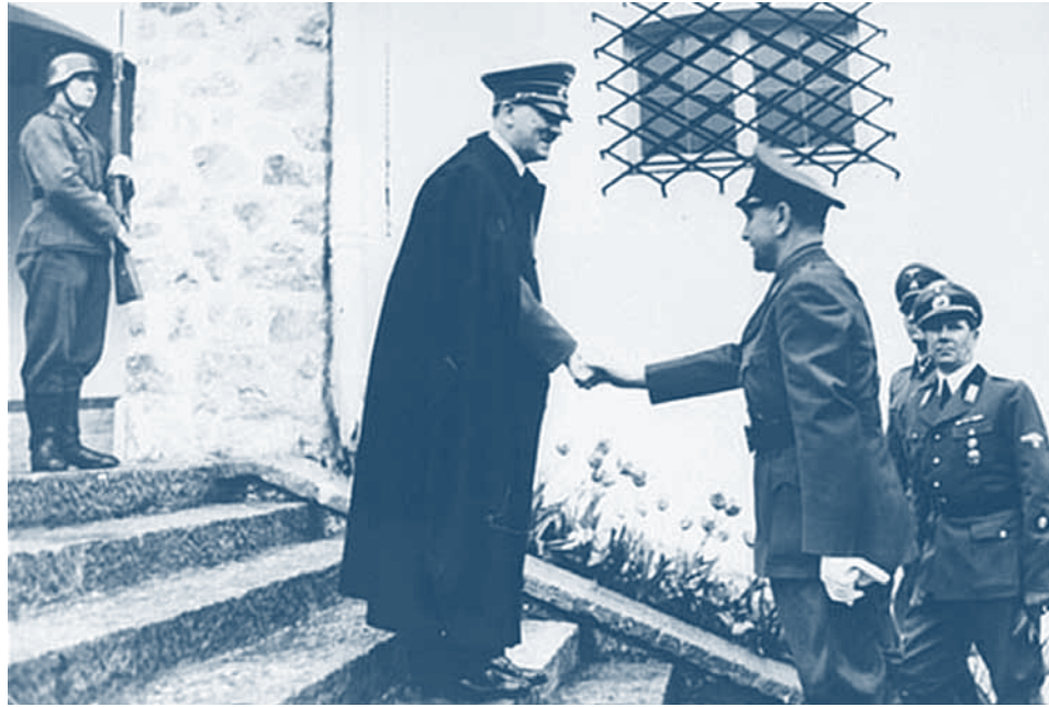
↑ La première rencontre d'Ante Pavelic avec Adolf Hitler, le 6 juin 1941. La photo montre le rapport hiérarchique entre les deux chefs d'État, mais celui-ci n'empêchait pas Hitler de prendre son partenaire croate au sérieux. La rencontre portait sur l'homogénéisation ethnique de l'Europe du Sud-Est.