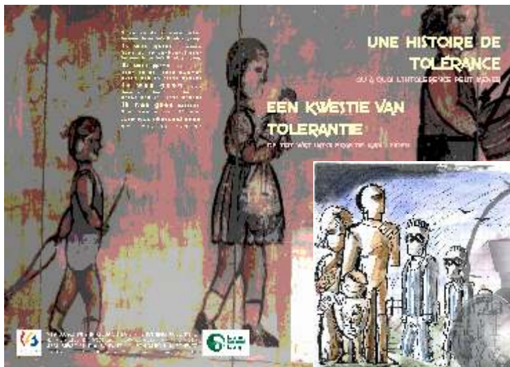
Quelques exemples de nos outils pédagogiques et didactiques