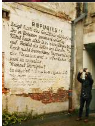
↑ Parcours du quartier