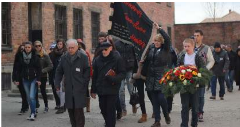
↑ Participation des lauréats à la cérémonie organisée au Mur des Fusillés, Voyage d'études à Auschwitz (2015)