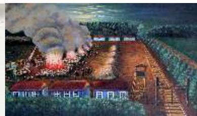
↑ Betzec - Les bûchers Wacław Kołodziejczyk