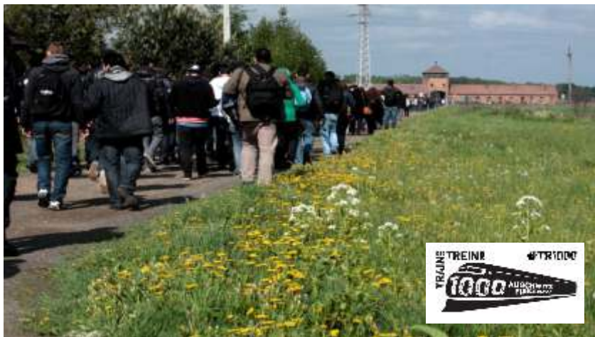
↑ 1 000 jeunes font la marche de la Alte Judenrampe vers l'entrée du camp de Birkenau (Auschwitz II)

En 2012 et en 2015, le Train des 1000 a conduit 1 000 jeunes de toute l'Europe vers Auschwitz. Un projet pédagogique exceptionnel.