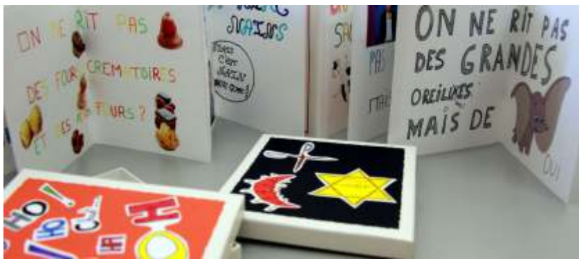
↑ Le travail gagnant sur le thème Peut-on rire de tout?