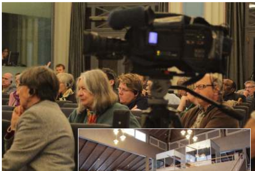
Conférences et formations pédagogiques