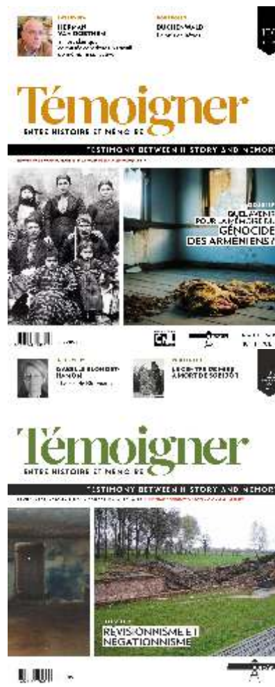
↑ Quelques exemples de publications pluridisciplinaires de l'ASBL Mémoire d'Auschwitz : la collection Entre Histoire et Mémoire et la revue Témoigner

La recherche et la mémoire constituent les impulsions d'origine qui ont amené les membres de l'Amicale Belge à créer la Fondation Auschwitz .