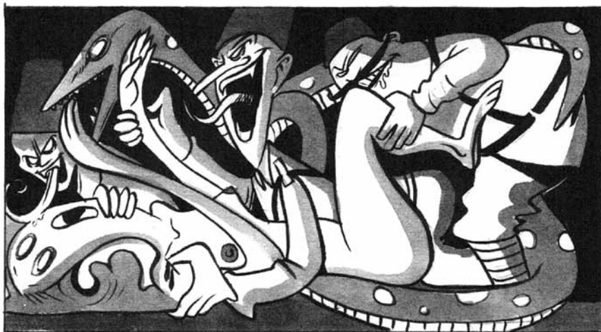
ILL. 3 / Paolo Cossi, Medz Yeghern, Le Grand mal , p. non numérotées © Cossi – Dargaud, 2009.

Medz Yeghern, le grand mal , c'est également un album ouvert à d'autres arts et artistes. Paolo Cossi s'intéresse comme on l'a vu à la photographie mais il rend également hommage à Picasso. Il dessine ainsi une scène terrible de viol d'une jeune arménienne par plusieurs soldats turcs qui est directement inspirée par le tableau Guernica , une façon pour l'auteur de mettre en parallèle les atrocités commises en 1915 et celles situées subies par la petite ville espagnole le 26 avril 1937 (ill. 3).