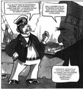
III. 4 / Paolo Cossi, Medz Yeghern, Le Grand mal , p. non numérotées © Cossi – Dargaud, 2009.

L'admiration de Paolo Cossi pour Hugo Pratt va plus loin que cette caricature de Corto Maltese dans Medz Yeghern, le grand mal , puisqu'il vient de publier, en juin 2010, le premier tome remarqué d'une biographie 44 dessinée de Hugo Pratt, trois autres tomes étant prévus d'ici la fin 2011.