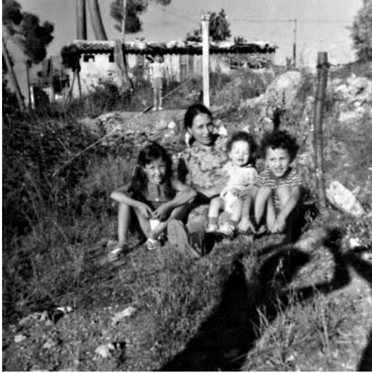
Camp de Mouans-Sartoux