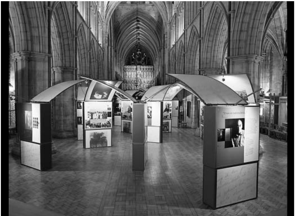
Reizende tentoonstelling. Bijschrift: Van de grote 'maxi'-versie van de reizende tentoonstelling 'Anne Frank-een geschiedenis voor vandaag' bestaat ook een compactere ('mini')-versie voor scholen en andere instellingen.

Op allerlei manieren probeert de Anne Frank Stichting jongeren in binnen- en buitenland informatie te geven. De educatieve uitgangspunten zoals die worden gehanteerd staan op dit moment binnen de AFS niet fundamenteel ter discussie. Bij de uitwerking naar producten en activiteiten komt wel regelmatig de vraag aan de orde : 'welke doelgroepen willen we met welke producten en activiteiten bereiken ?' Want het blijft steeds de vraag hoe met de beschikbare middelen een zo groot mogelijke groep zo effectief mogelijk kan worden bereikt.