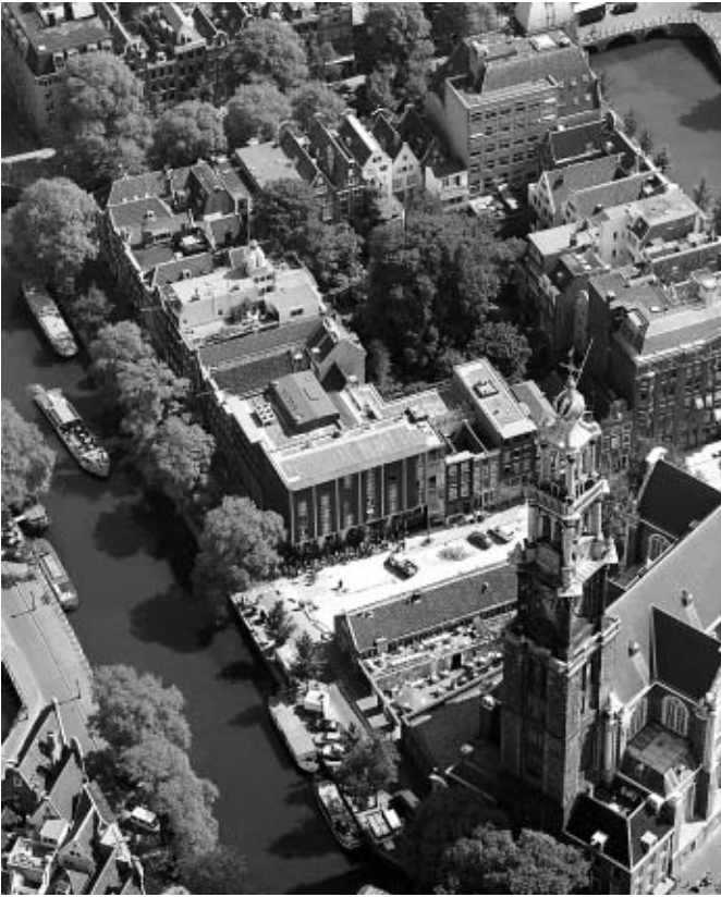
Luchtfoto Anne Frank Huis 1999. Bijschrift: Het Anne Frank Huis met de nieuwe aanbouw in 1999.

In de opzet van het museum, maar ook in de vele activiteiten die daarnaast worden ontplooit, spelen een aantal educatieve uitgangspunten een belangrijke rol. Afhankelijk van de doelgroep en de soort activiteit krijgen die een verschillende uitwerking. Enkele van deze uitgangspunten zijn :