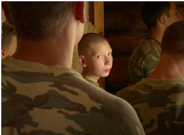
Le documentaire « Un été avec Anton » (2013) retrace le parcours d'un adolescent dans un camp d'entraînement militaire en Russie

La multiplication de camps militaires pour enfants dans plusieurs pays d'Europe de l'Est et de l'ancienne Union soviétique est un autre phénomène particulièrement interpellant. Il en existe notamment en Hongrie et en Ukraine, mais c'est surtout en Russie qu'ils connaissent un développement spectaculaire, depuis l'arrivée de Vladimir Poutine au pouvoir.