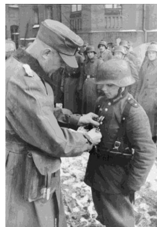
Décoration d'un soldat allemand âgé de 16 ans en Basse-Silésie, mars 1945

Les nazis ne se préoccupaient guère de déterminer la majorité en fonction du développement moral. Dans le camp de concentration et le centre d'extermination d'Auschwitz-Birkenau, les enfants n'avaient pas le droit d'accéder au secteur concentrationnaire. Ils n'étaient d'aucune utilité (économique ou ontologique) pour les nazis et étaient donc immédiatement conduits à la chambre à gaz.