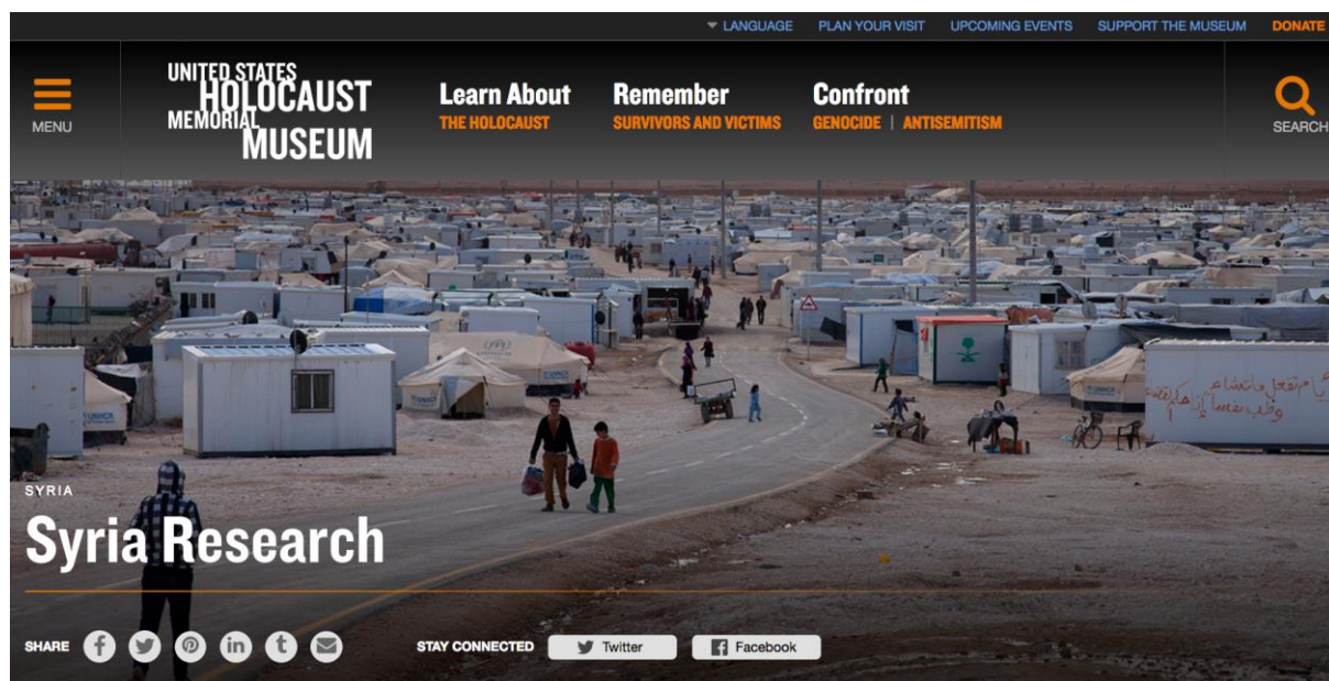
Le site Internet de l'USHMM relaye des études et de la documentation consacrées à des conflits récents ou actuels.

Kazerne Dossin n'a pas les mêmes prémices, la même histoire, ni des moyens comparables à ceux de l'USHMM, mais on entend aussi y faire des liens avec des situations actuelles et susciter une réflexion non seulement sur la persécution des Juifs de Belgique, mais également sur les droits humains en général. Ceux-ci sont au centre des préoccupations des responsables du musée et « le conflit 1940-1944 fait fonction d'avertissement moral et politique. » 2 Les thèmes de la discrimination et de l'exclusion sont abordés, de même que la violence de masse dont la forme extrême est le génocide. Des programmes éducatifs (ateliers, formations) ont été développés, liés à diverses problématiques et pour différents publics. « Holocauste, police et droits de l'Homme » est, par exemple, un programme destiné aux policiers de tous grades qui a été amorcé en 2014 dans le cadre d'une collaboration structurelle entre la police fédérale, Kazerne Dossin et Unia. Rappelons par ailleurs que les questions internationales et contemporaines (telles que le Guatemala, le Rwanda ou Srebrenica) sont bien présentes également, entre autres à travers la programmation d'expositions temporaires.