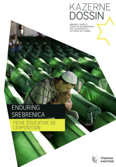
Fiche éducative accompagnant l'exposition « Enduring Srebrenica » (2013).

ignorant ce qui s'est passé au Rwanda ou qui se déroule aujourd'hui en Birmanie, au Soudan ou en Syrie ? Si l'histoire reste au cœur de l'objet de ces institutions, elle résonne inévitablement avec l'actualité. Mais un musée n'a a priori pas une fonction politique, journalistique ou militante. Les équipes qui élaborent le contenu des expositions sont composées essentiellement de chercheurs soucieux d'interroger l'histoire et de la transmettre. Mais sont-ils armés pour aborder les crimes qui se déroulent à travers le monde aujourd'hui ? Est-ce leur rôle ? Face à des questions si ouvertes, il est évidemment illusoire d'espérer des réponses assertives. Chaque musée s'inscrit par ailleurs dans un territoire donné et est déterminé par son propre passé, son identité et, bien entendu, ses moyens. Kazerne Dossin n'a pas les mêmes capacités sur le plan de l'infrastructure et des ressources humaines que l'USHMM ou la Maison de l'histoire européenne. Les représentants des musées présents lors du débat s'accordaient à soutenir que leurs institutions ont – même si le cœur de leur travail reste la transmission de l'histoire – aussi pour rôle d'interroger le présent à l'aide du passé et donc d'être des acteurs actifs et positifs de nos sociétés, ce qui concrètement peut se traduire par des initiatives diverses : expositions temporaires, conférences, formations, études, etc.