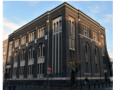
Synagogue, rue de la Clinique