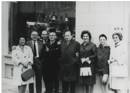
Boulangerie Borenstein, s.d.