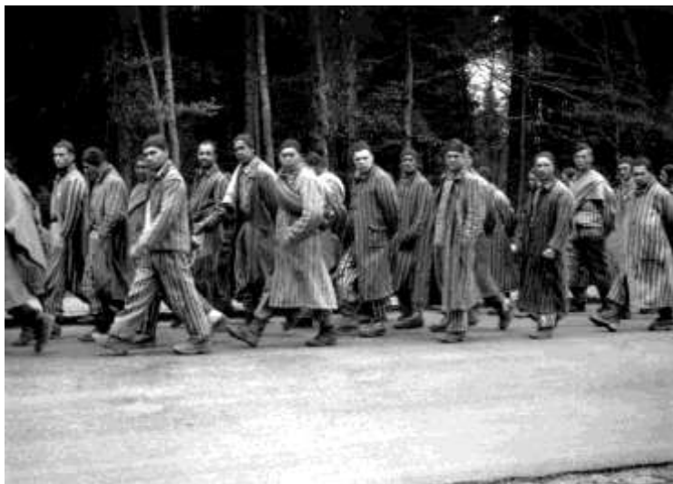
Prisonniers évacués dans la région de Dachau.