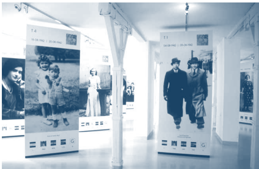
↑ Belgisch paviljoen (vernieuwde opstelling). Auschwitz I. Oktober 2007.

In deze status quaestionis, die slechts een voorlopige schets is over pedagogische reizen naar Auschwitz in het bijzonder en over herinneringsreizen in het algemeen, lijkt het me nodig om een fundamentele dimensie te vermelden waarmee elke bezoeker te maken krijgt en die bovendien de lesgevers – of meer in het algemeen de begeleiders – in verlegenheid brengt. De dimensie waarover ik het heb is die van de emotie. Over het grootste kerkhof ter wereld lopen, stelt iemand bloot aan emoties, zelfs wanneer men zelf geen familielid heeft dat er heeft geleden of er dood heeft gevonden. Maar misschien moet men zich in het kader van deze reizen afvragen hoe de emotie zich verhoudt tot de verklarende rede, tot de wil om te begrijpen; hoe de emotie als vehikel dient om een stuk kennis beter te assimileren en zich toe te eigenen, hoe zij de band tussen het zelf en datgene waarmee het in verband treedt, in casu Auschwitz, creëert of nog versterkt. Uiteraard zullen de critici van de emotie, die de critici van dergelijke reizen in het algemeen vaak bijtreden, betogen dat de emotie het begripsvermogen ondermijnt en de rede kortsluit. Of deze kritiek niet meer is dan een mening, dan wel gebaseerd is op kennis die de retoriek ons gebracht heeft, het is in elk geval juist dat emotie in sommige omstandigheden nefast kan zijn om