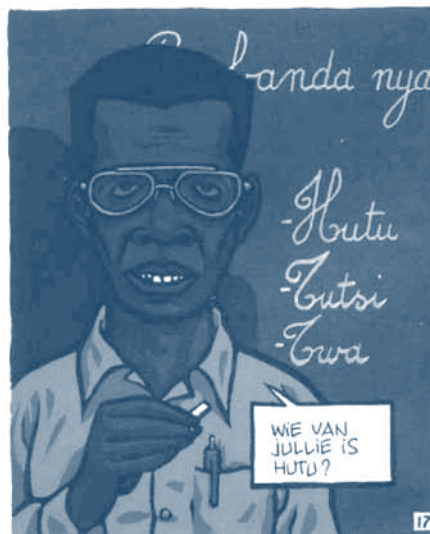
Jean-Philippe Stassen, Deogratias , p.19, strook 3, panels 2 en 3 © Dupuis, 2000

DOELSTELLINGEN: _ Aantonen via welke vectoren en welke situaties het discriminatieproces in Rwanda werd opgebouwd. _ Een definitie van de notie « etniciteit » formuleren.