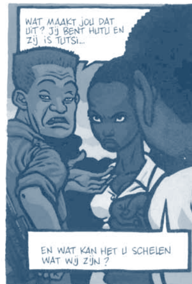
Jean-Philippe Stassen, Deogratias , p.24, strook3, panel 1 en p.25, strook 1, panel 3 © Dupuis, 2000

die verplicht waren voor gezonde volwassen mannen; deze vermelding verving die van de clan, en vaak was de differentiëring gebaseerd op het aantal koeien dat men bezat” (12) . In het bestek van één plaat laat Stassen de realiteit zien van een identiteitscontrole van busreizigers op weg naar Kigali door Europese militairen. Bénigne en Deogratias bevinden zich onder de reizigers en proberen in opstand te komen tegen een discriminatiepolitiek die, gevoerd op gezag van Europese militairen, volgens hen geen enkele legitimiteit heeft. Uiteindelijk toont Stassen met deze twee sequenties goed aan dat de discriminatieprocessen in Rwanda berusten op de instrumentalisering en de politieke manipulatie van de zogenaamde “eticiteit” (13) , waarbij de Tutsi's worden gediaboliseerd.