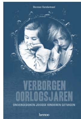
(1) H. Vandormael. Ondergedoken Joodse kinderen getuigen. Verborgen oorlogsjaren . Lannoo. Tielt, 2009 (heruitgegeven in datzelfde jaar); Les enfants cachés se souviennent. Les années de guerre . Racine. Brussel, 2010.

documenten ter hand te nemen. Omdat ze niet op zichzelf kunnen staan, is het nodig andere bronnen of historische werken te raadplegen om de betekenis van deze waardevolle getuigenissen ten volle te vatten in de klasomgeving.