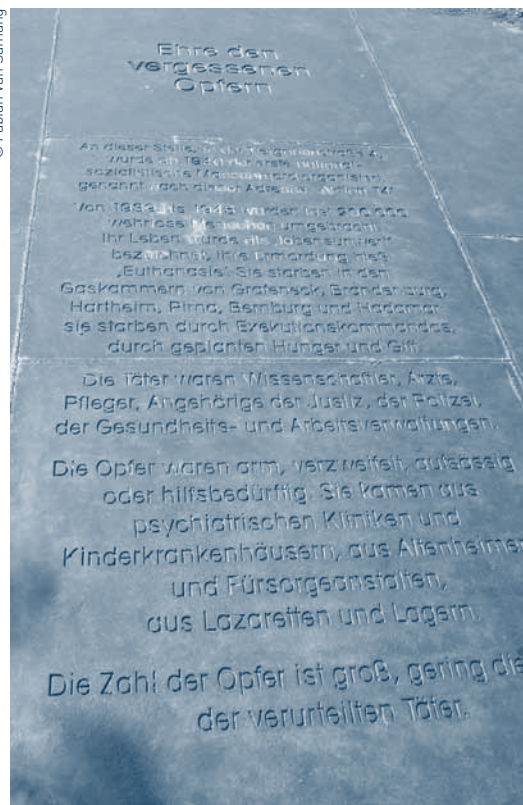
(18) Archief Provincie Oost-Vlaanderen (documenten van de Provinciale School voor Verpleegkunde, persoonlijk dossier A. Vankerckhove).