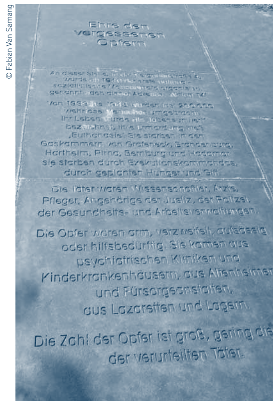
(18) Archief Provincie Oost-Vlaanderen (documenten van de Provinciale School voor Verpleegkunde, persoonlijk dossier A. Vankerckhove).

Een uitgebreide versie van dit artikel werd gepubliceerd in het tijdschrift 'Getuigen, tussen geschiedenis en herinnering' (nummer 112, pp. 124-136). De inhoudstafel en samenvattingen van dit themanummer vindt u op http://www.auschwitz.be/index.php?option=com_content&view=article&id=750:inhoudstafel-en-samenvattingen-nr-112&catid=37 .