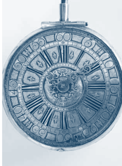
↑ 'Alle verwunden, eine tödtet' (Alle uren verwonden, het laatste uur doodt). In zijn roman herneemt Philippe Claudel dit devies, gegrift in een zeventiende eeuwse Duits reishorloge, gemaakt door Benedikt Fürstenfelder, klokkenmaker te Fridberg.

Door de tegenstelling tussen vuiligheid en zuiverheid kan aan de lezer de moeilijke verhouding worden verduidelijkt tussen Goed en Kwaad in de samenleving in het algemeen en bij de verscheidene dorpingen in het bijzonder.