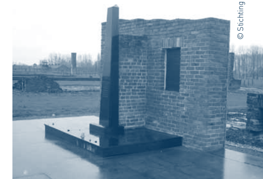
↑ Monument ter ere van de Roma en Sinti, ingewijd in 1997 op de plaats van barak 28 in het Familienlager te Birkenau.

Het totale aantal doden is moeilijk in te schatten, onder meer omdat we niet weten hoeveel Roma en Sinti na de oorlog in Europa leefden. De schatting van het aantal slachtoffers varieert van tienduizenden tot 200 000 en naar maxima van 1,5 miljoen. Men spreekt vaak over de genocide van de Roma en Sinti gepleegd door de nazi’s, maar ook de term Holocaust van de Roma en Sinti komt voor. Taalkundigen hebben termen in het Romani, de talengroep van de Roma en Sinti, voorgesteld om deze misdaad te bestempelen. Zo komt men Porrajmos (verslinding) 8 tegen, voorgesteld door de Roma linguïst Ian Hancock en Samoudaripen (massamoord). Het lijden van de Roma en Sinti hield niet op met het einde van de oorlog. De discriminatie ging soms door na de oorlog, bijvoorbeeld in Beieren. In Frankrijk werden de laatste Roma en Sinti pas in mei 1946 bevrijd 9 . Het heeft enkele decennia geduurd voor de