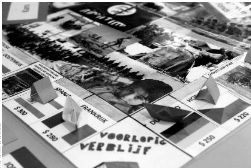
Mensenhandelswaarde: Bootjes en tenten op het bord van Monopoly voor Vluchtelingen ↓

Brasschaat maakte een "Monopoly-spel voor Vluchtelingen", compleet met KANS-kaarten, bootjes en tenten... Twee van deze acht leerlingen gingen samen met 3 andere laureaten tijdens de lentevakantie mee op onze vijfdaagse studiereis naar Auschwitz.