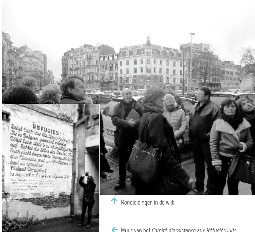
↑ Rondleidingen in de wijk