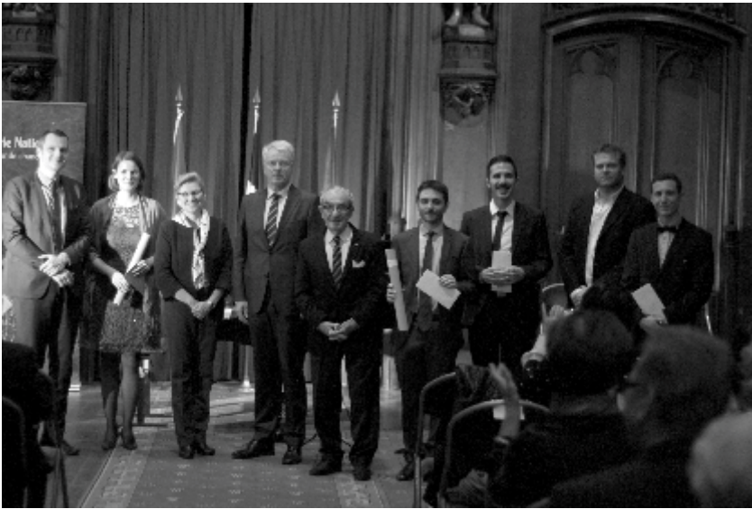
↑ Academische zitting van de Prijsuitreiking van de Stichting Auschwitz, 2015

Als afsluiter worden al de andere projecten van vzw Auschwitz in Gedachtenis/Stichting Auschwitz voor u op een rijtje gezet