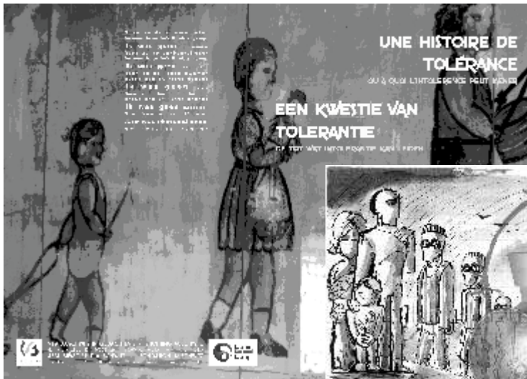
Een greep uit onze pedagogische en didactische instrumenten