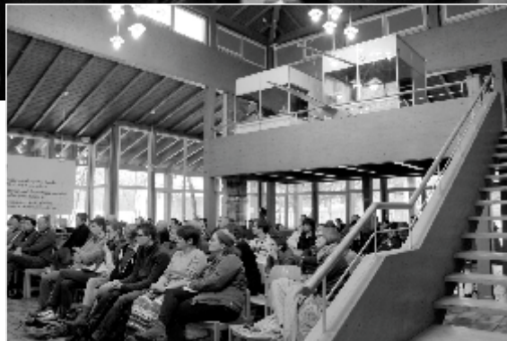
Conferenties en pedagogische vormingsdagen

Waarde lezer, Beste leerkracht(e) en toekomstige leerkracht(e),