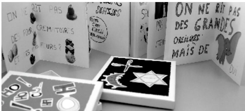
↑ Winnende inzending waarvan het thema dat jaar was: Mag men met alles lachen?