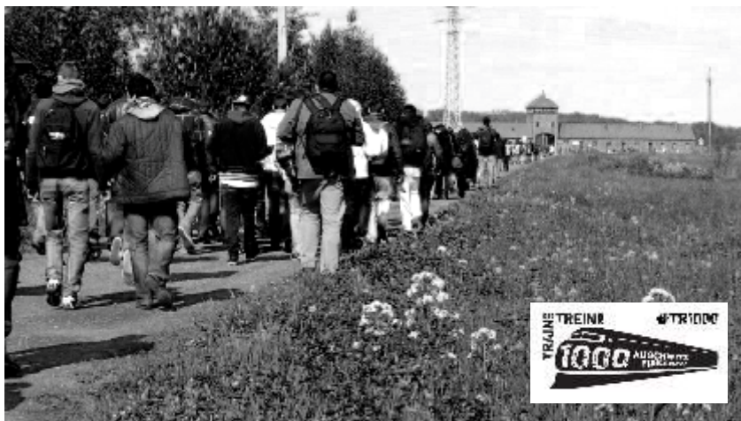
↑ 1 000 jongeren stappen van de Alte Judenrampe naar de ingangspoort van Birkenau (Auschwitz II)

In 2008 reed de Trein van de Vrede met 400 jongeren aan boord naar Buchenwald. In 2012 en 2015 vervoerde de Trein der 1000 jongeren uit heel Europa naar Auschwitz. Een uitzonderlijk pedagogisch project.