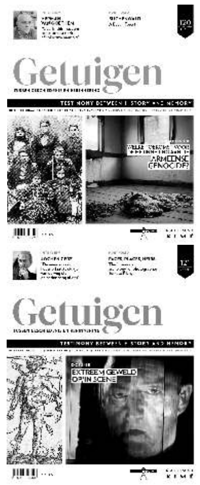
↑ Een greep uit de multidisciplinaire publicaties van de vzw Auschwitz in Gedachtenis, waaronder het tijdschrift Getuigen tussen Geschiedenis en Herinnering

Geachte belanghebbende, Geachte geïnteresseerde,