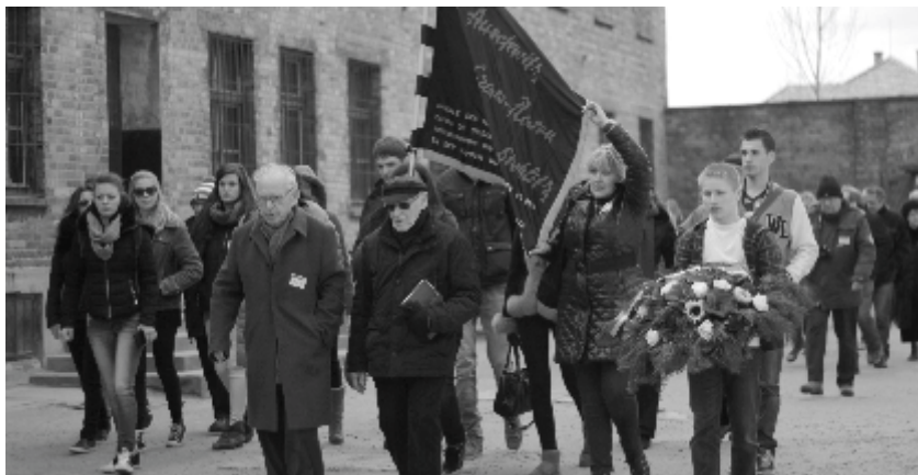
↑ Deelname van de laureaten aan de ceremonie aan de Muur der Gefusilleerden , Studiereis naar Auschwitz (2015)