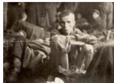
↓ Foto van een Muselmann , genomen bij de bevrijding van Dachau