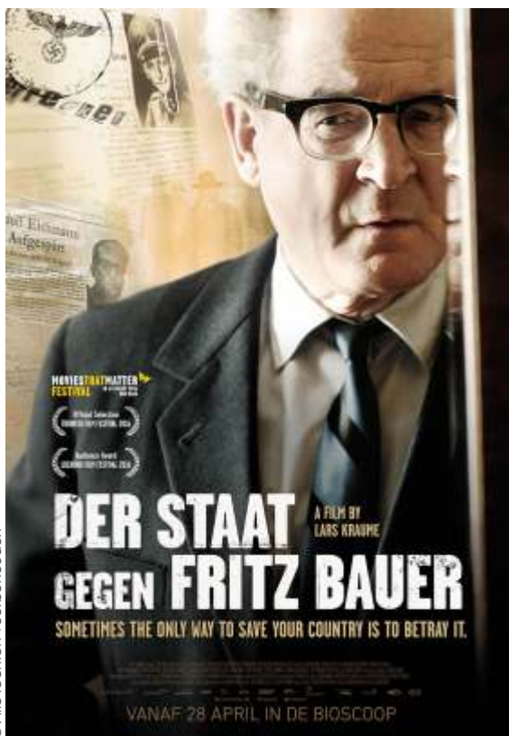
↑ Der Staat gegen Fritz Bauer Affiche van de film van Lars Kraume

Duitsland werpt de laatste jaren een steeds kritischer blik op zijn verleden. Dat bewijzen heel wat recente films, waaronder ook deze Der Staat gegen Fritz Bauer .