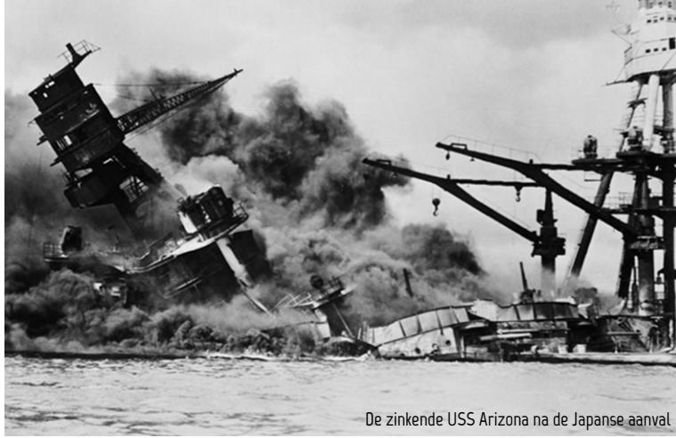
De zinkende USS Arizona na de Japanse aanval