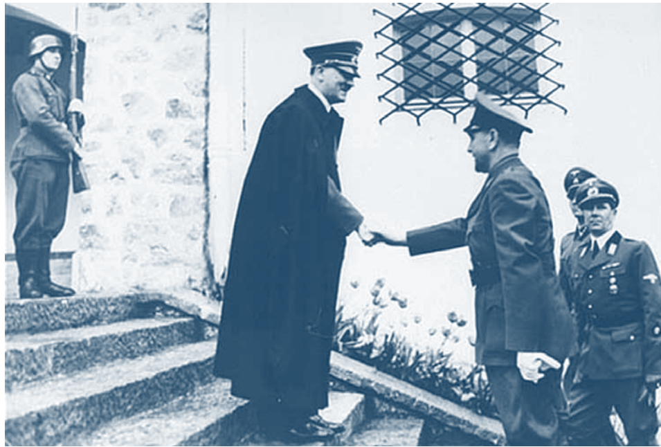
↑ De eerste ontmoeting met Adolf Hitler op 6 juni 1941. De foto toont de hiërarchie tussen de staatshoofden, maar kan niet verhullen dat Hitler zijn Zuid-Oost-Europese partner doorgaans serieus nam. Op de ontmoeting werd gesproken over de etnische homogenisering van Zuid-Oost-Europa.

Dit was de ideologische lijn voor de geweldacties van de Ustaša vanaf het voorjaar van 1941. In uitvoering van een akkoord over gedwongen migratie dat de Ustaša in juni 1941 met de Duitsers had gesloten, begon ze nu honderdduizenden Slovenen uit de geannexeerde Sloveense gebieden naar 'Groot Kroatië' te verdrijven. Daarbij pleegden de milities van de Ustaša massamoorden in gebieden waar veel Serviërs woonden en verwoestten ze de dorpen waar ze verzet verwachtten. In hun netwerk van kampen hielden de leden van de Ustaša tienduizenden Joden, Roma en politieke tegenstanders gevangen. De meeste gevangenen werden er vermoord of werden er het slachtoffer van de onmenselijke leefomstandigheden. Vooral het kamp Jasenovac werd als geen andere plaats het symbool van het massale geweld van de Ustaša. Het kamp, dat zich op een honderdtal kilometer van Zagreb bevond, was het grootste van het Balkanschiereiland; ongeveer 100 000 Serviërs, Joden, Roma en politieke tegenstanders vonden er de dood. Zonder hier in detail in te gaan op de bedreven misdaden, kunnen we toch wijzen op drie structurele kenmerken. Ten eerste bedreven de Ustašabeweging en de diverse bestuurlijke niveaus van de Kroatische staat in geen geval een monolithische politiek. De regering had de intentie om