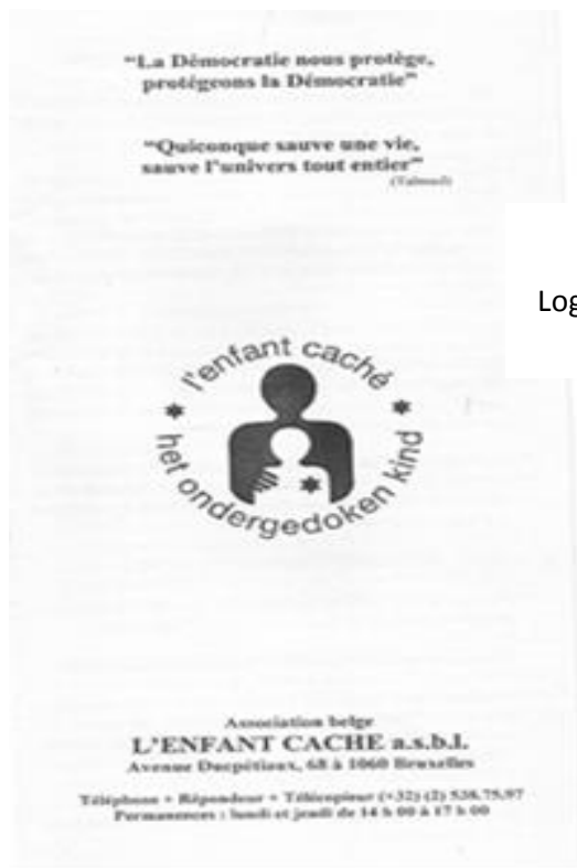
Logo de l'association belge : L'ENFANT CACHE a.s.b.l.