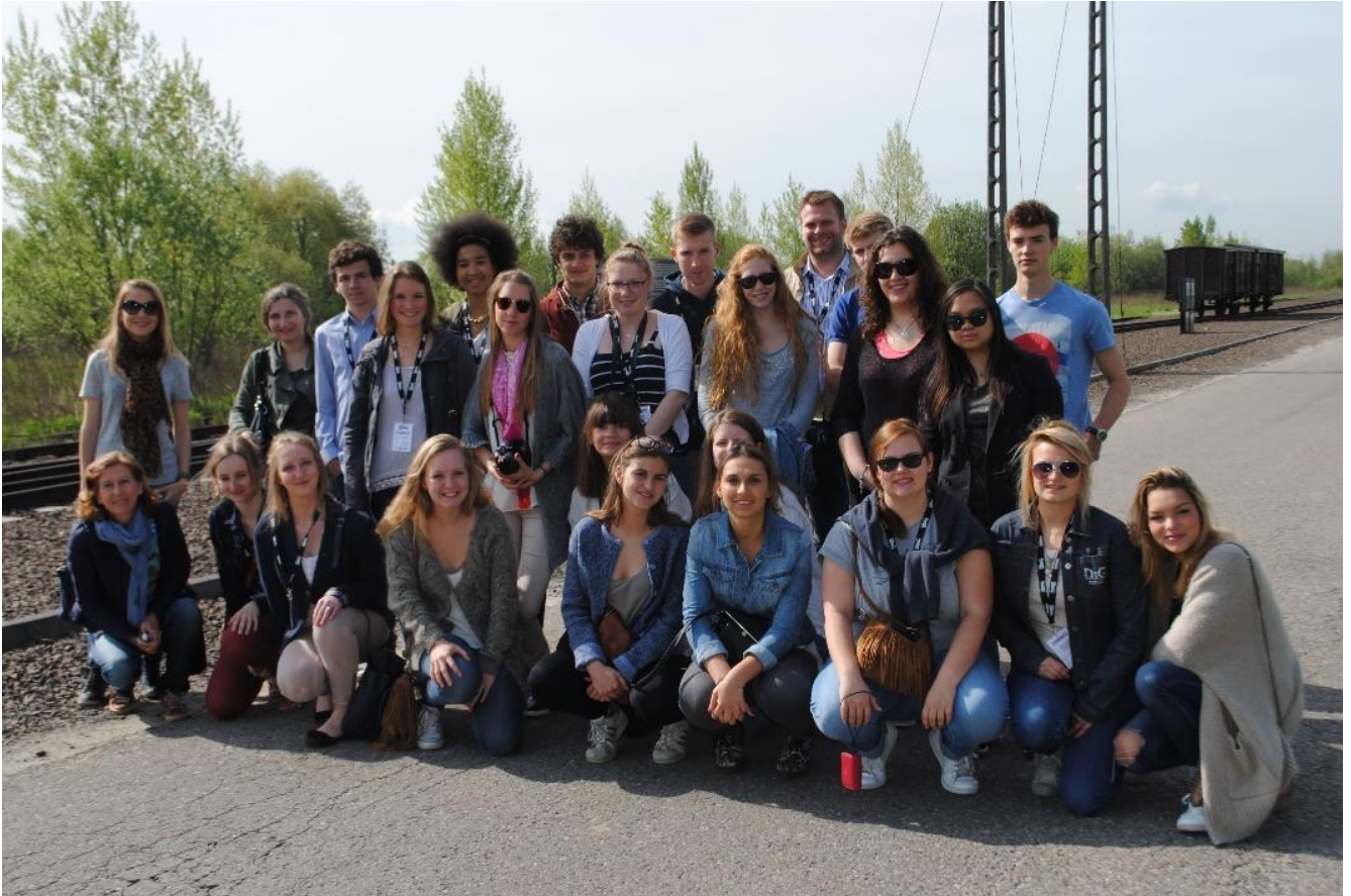
Les 23 jeunes du Lycée Saint Jacques participant au « Train des 1000 » 2015. Auschwitz.