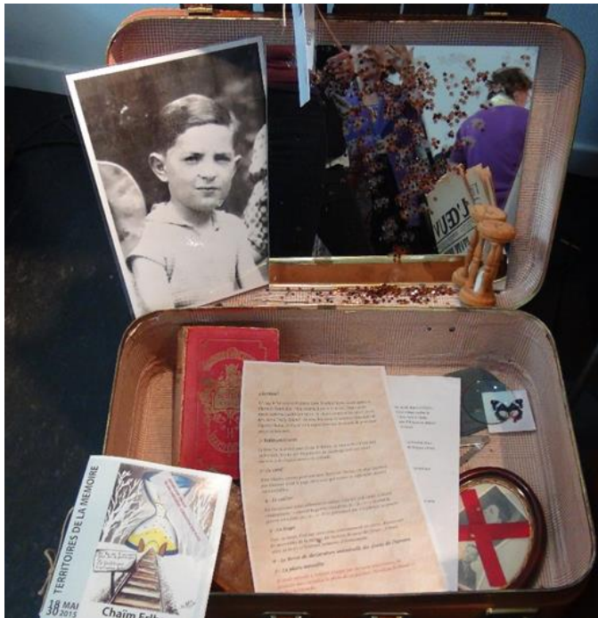
Territoires de la Mémoire, 30 mai 2015. Photo d'Anne Salien

Dans celle-ci sont disposés des objets appartenant à Chaïm :